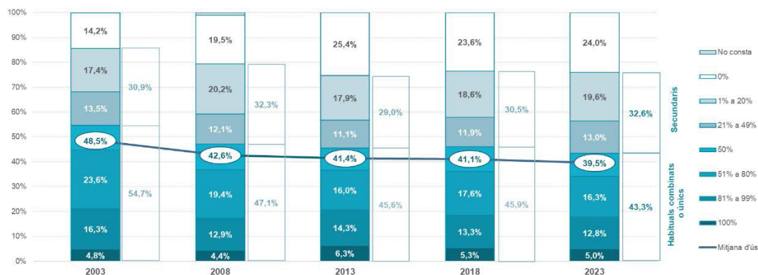
Gràfic 3. Evolució 2003-2023 del percentatge de parlants ≥15a segons el seu grau d'ús diari del català.

Font: Idescat i Departament de Política Lingüística. Enquesta d'usos lingüístics de la població, 2003 - 2023.