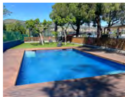
Piscina del Club Pàdel de Can Teixidó.