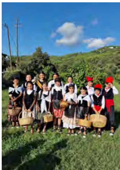
Dames d'honor, pubilla i hereus de 2025.

Les inscripcions s'han de fer de l'1 al 21 de juny mitjançant el formulari disponible a alella.cat/damesi-hereus2026 . El nombre de places és limitat a 12 participants. En cas que la demanda superi l'oferta, l'assignació es farà per sorteig el 22 de juny. Els infants empadronats al municipi tindran prioritat en l'adjudicació de places. La participació com a hereu i dama d'honor és una oportunitat per contribuir a mantenir aquesta tradició i formar part activa de la festa.