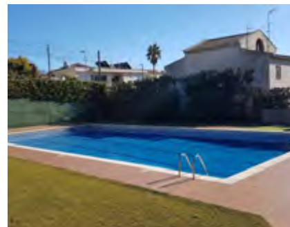
Piscina del Club Alella Sistres.

L'Ajuntament agraeix a les tres entitats la col·laboració i la bona predisposició a arribar a acords que faran possible l'obertura de les seves instal·lacions a tota la ciutadania. Més informació a alella.cat/piscines .