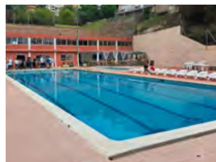
Piscina del Club Alella Esport, a Alella Parc.