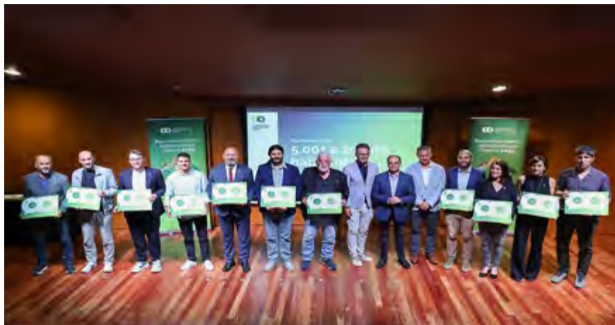
Alella ocupa la segona posició en maduresa digital en els ajuntaments d'entre 5.000 i 20.000 habitants.

L'Ajuntament va tramitar l'any passat més de 13.500 registres d'entrada, prop de 9.000 registres de sortida,